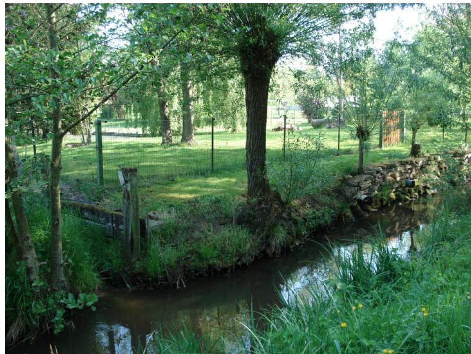
La vallée de la Crise à Chacrise

Aujourd'hui, certains riverains observent des attitudes responsables. Quelques exploitants de peupleraies respectent les règles de plantation préconisant une distance entre les premiers plants et les berges. Le nettoyage a favorisé dans la mesure du possible la protection de certaines essences arbustives utiles telles que l'aulne dont la présence fait barrière aux dégâts causés par les peupliers. Les feuilles de ces derniers, accumulées dans l'eau, gênent l'action chlorophyllienne en obstruant la lumière et pourrissent en dégagant du gaz carbonique tuant ainsi les poissons. Si la Crise a retrouvé globalement un bel éclat avec une eau claire et un retour de la faune aquatique, des zones noires subsistent notamment en aval au débouché de l'agglomération urbaine de Soissons.