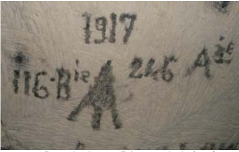
116eme Batterie du 246 RA, au noir de fumée.

mière guerre mondiale ou si vous avez un doute sur l'origine d'une inscription se trouvant sur vos murs, vous pouvez contacter directement le délégué de Soissonnais 14/18 Jérôme Buttet au 03 23 72 36 43 ou bien la Mairie qui transmettra.