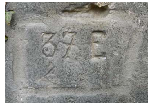
Gravure du 37 e RAC.

façades, de l'érosion de la roche et tout simplement par le démantèlement de certains murs ou l'effondrement des carrières. Si vous connaissez des graffiti de la pre-