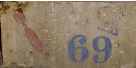
Crapouillot et 69 peints au pochoir.

Le travail de ce dernier s'inscrit aussi dans le cadre d'un diplôme de master en cours à l'Université de Reims. A lire : Le graffiti des tranchées, sous la coordination de H. Vatel et M. Boittiaux, édit. Soissonnais 14-18, 2008, 287 pages, prix 43 €.