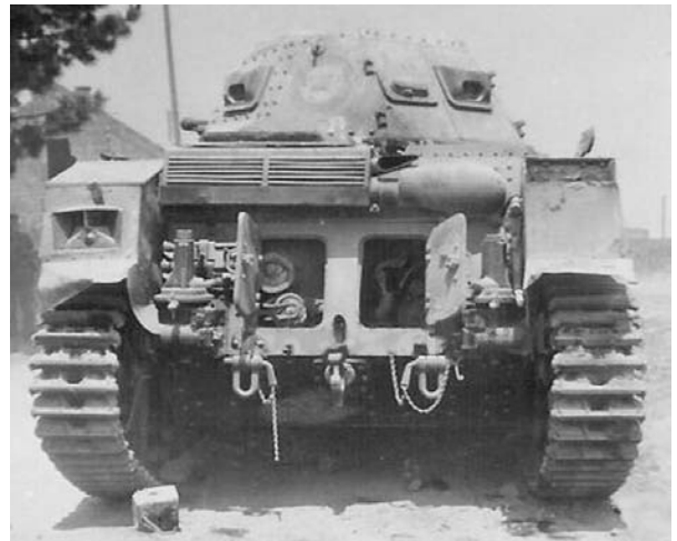
Toujours le même véhicule. A gauche le pignon de la maison des ouvriers agricoles et à droite l'autre maison.