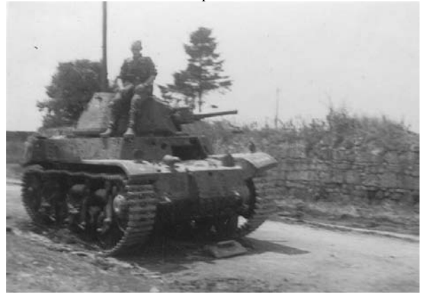
Le même véhicule. A l'arrière le mur de la ferme du Mont de Soissons.

la voie Decauville. Le canon pointe sur la ferme.