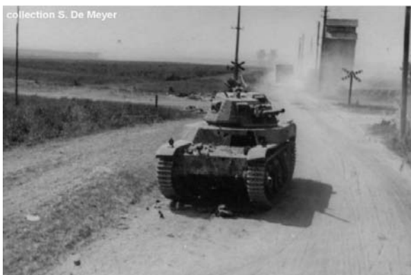
Photo prise probablement le lendemain matin. L'angle du mur de la ferme à droite, le transformateur, la signalisation de

Les clichés publiés ici sont visible sur le site suivant : http://www.chars-francais.net/