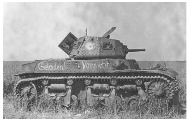
Un second char, à proximité du croisement de la route de Fère. Le canon pointe en direction de la ferme. A l'arrière la butte du Mont-de-Soissons.